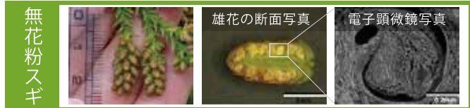
無花粉スギも普通のスギと同じように雄花を着けます。

【説明】 花粉を全く生産せず、林業用種苗として適した特性を有するもの。 雄花は一般のスギと同様に着けるが、花粉は生産しない。